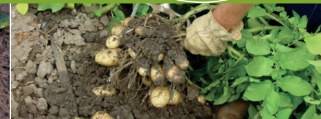
Kad bumbuļi sasnieguši 60 % no pilna izmēra