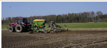
Kopā ar sēju